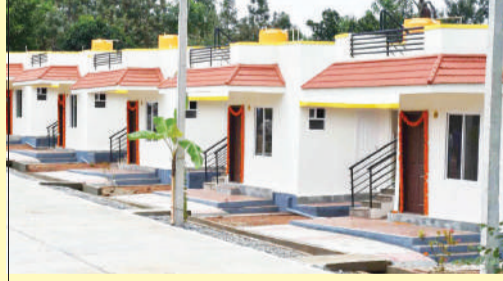
ಮೊದಲ ಬಾರಿಗೆ ಪ್ರತಿ ಮನೆಗೂ 10 ಲಕ್ಷ ಪರಿಹಾರ ಘೋಷಿಸಿದರು. ಕುಮಾರಣ್ಣ ಅವರ ಇಂದು ಕೊಡಗಿನಲ್ಲಿ 800ಕ್ಕೂ ಅಧಿಕ ಸಂತ್ರಸ್ತರ ಕುಟುಂಬಗಳು ಉತ್ತಮ ಮನೆಗಳಲ್ಲಿ ಜೀವನ ಸಾಗಿಸುತ್ತಿವೆ. ಮನೆ- ಆಸ್ತಿ ಕಳೆದುಕೊಂಡ ಸಂತ್ರಸ್ತರಿಗೆ ಅಂದಿನ ಮುಖ್ಯಮಂತ್ರಿ ಯಾಗಿದ್ದ ಕುಮಾರಣ್ಣ ಅವರು ಎರಡು ಬೆಳಿಗ್ಗೆ ಸಾಮರ್ಥ್ಯವುಳ್ಳ ಸುಂದರ ಮನೆಯನ್ನು ನಿರ್ಮಿಸಲು ಯೋಜನೆ ರೂಪಿಸಿದ್ದರು. ಇದೀಗ 800ಕ್ಕೂ ಹೆಚ್ಚು ಸಂತ್ರಸ್ತರು ಕುಮಾರಣ್ಣ ಅವರ ಯೋಜನೆಯ ಮನೆಯಲ್ಲಿ ನೆಲೆ ಕಂಡುಕೊಂಡಿದ್ದಾರೆ.

2018ರ ಆಗಸ್ಟಿನಲ್ಲಿ ಕೊಡಗು ಜಿಲ್ಲೆಯಲ್ಲಿ ಕಂಡುಕೊಳ್ಳಲಾದ ಪ್ರಕೃತಿ ವಿಕೋಪ ಸಂಭವಿಸಿತು. ಒಂದು ಕಡೆ ಪ್ರವಾಹ, ಮತ್ತೊಂದು ಕಡೆಯಲ್ಲಿ ಭೂಕಂಪಿತ ಸಂಭವಿಸಿ ಅಪಾರ ಸಾವು-ನೋವು ಉಂಟಾಯಿತು. ಈ ಸಂದರ್ಭ ಸತತವಾಗಿ ಕೊಡಗಿನ ಭೇಟಿ ನೀಡಿದ್ದ ಕುಮಾರಣ್ಣ, ಕೊಡಗಿನ ಪ್ರಕೃತಿ ವಿಕೋಪ ಸಂಬಂಧ ಹಿರಿಯ ಅಧಿಕಾರಿಗಳ ಜತೆ ಸಭೆ ನಡೆಸಿ, ನಿರಾಶ್ರಿತರ ಸಮಸ್ಯೆ ಅರಿಯಿತು. ಕೊಡಗಿನಲ್ಲಿ ಪ್ರಕೃತಿ ವಿಕೋಪದಿಂದ ಮನೆ ಕಳೆದುಕೊಂಡ ಎಲ್ಲ ನಿರಾಶ್ರಿತರಿಗೆ ಸರ್ಕಾರದಿಂದಲೇ ಹೊಸ ಮನೆ ಕಟ್ಟಿಕೊಟ್ಟು ಹೊಸ ಬದುಕು ಕಲ್ಪಿಸಲಾಗುವುದು ಎಂದರು. ರಾಜ್ಯದ ಇತಿಹಾಸದಲ್ಲೇ ಮೊದಲ ಬಾರಿಗೆ ಪ್ರತಿ ಮನೆಗೂ 10 ಲಕ್ಷ ಪರಿಹಾರ ಘೋಷಿಸಿದರು. ಕುಮಾರಣ್ಣ ಅವರ ಇಂದು ಕೊಡಗಿನಲ್ಲಿ 800ಕ್ಕೂ ಅಧಿಕ ಸಂತ್ರಸ್ತರ ಕುಟುಂಬಗಳು ಉತ್ತಮ ಮನೆಗಳಲ್ಲಿ ಜೀವನ ಸಾಗಿಸುತ್ತಿವೆ. ಮನೆ- ಆಸ್ತಿ ಕಳೆದುಕೊಂಡ ಸಂತ್ರಸ್ತರಿಗೆ ಅಂದಿನ ಮುಖ್ಯಮಂತ್ರಿ ಯಾಗಿದ್ದ ಕುಮಾರಣ್ಣ ಅವರು ಎರಡು ಬೆಳಿಗ್ಗೆ ಸಾಮರ್ಥ್ಯವುಳ್ಳ ಸುಂದರ ಮನೆಯನ್ನು ನಿರ್ಮಿಸಲು ಯೋಜನೆ ರೂಪಿಸಿದ್ದರು. ಇದೀಗ 800ಕ್ಕೂ ಹೆಚ್ಚು ಸಂತ್ರಸ್ತರು ಕುಮಾರಣ್ಣ ಅವರ ಯೋಜನೆಯ ಮನೆಯಲ್ಲಿ ನೆಲೆ ಕಂಡುಕೊಂಡಿದ್ದಾರೆ.